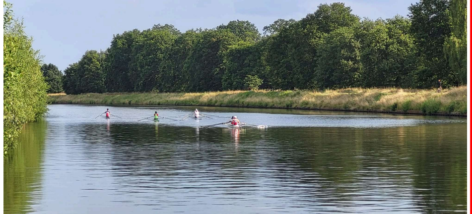
Avondtraining in de zon - Emblem - 01/07/2024

Vroegere nieuwsbrieven vind je ook op onze website the-oar.be/nieuwsbrief.htm