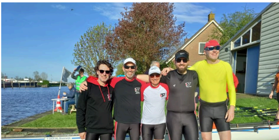
Weerribben Wieden roeimarathon 59 km

Vroegere nieuwsbrieven vind je ook op onze website the-oar.be/nieuwsbrief.htm