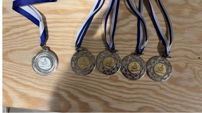
Blik uit Seneffe

Vroegere nieuwsbrieven vind je ook op onze website the-oar.be/nieuwsbrief.htm