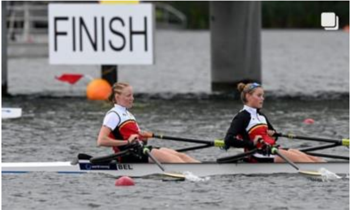
Foto: Lore en Louise, twee van de beste Belgische junioren roeiden zich op het wereldkampioenschap in de kijker met een knappe 9 e plaats op 24 deelnemende landen

Na haar derde plaats in skiff op de Jeugdcup, het officiële Europees Kampioenschap voor roeiers jonger dan 18 jaar, in 2022 in het Spaanse Castrelo de Mino waren de verwachtingen dit jaar hoog gespannen. Pas begin juli, na selectiewedstrijden in Seneffe en Hazewinkel wordt de finale selectie bekend gemaakt. Dan volgen er nog weken van twee dagelijkse trainingen waar de puntjes op de 'i' worden gezet