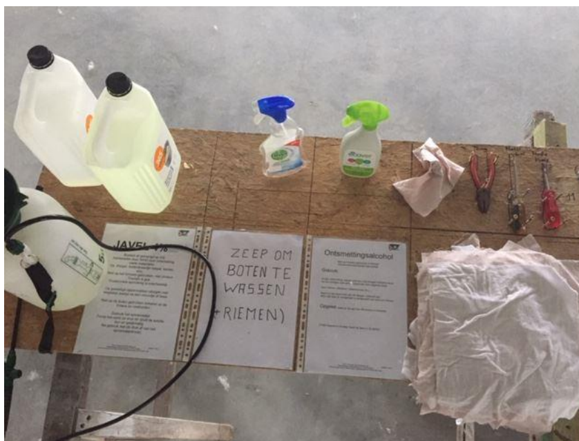
Roeien na corona : met deze hulpmiddelen gaan we verder

Vroegere nieuwsbrieven vind je ook op onze website the-oar.be/nieuwsbrief.htm