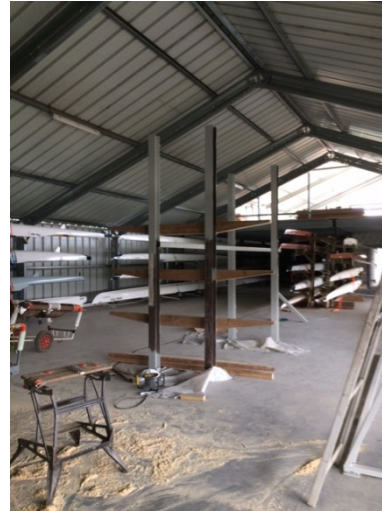
Het grote botenrek in aanbouw 6 boten hoog

Oude nieuwsbrieven vind je ook op onze website the-oar.be/nieuwsbrief.htm