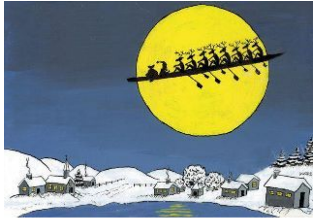
Een vrolijke kerstfeest en een voorspoedig Nieuwjaar!

Oude nieuwsbrieven vind je ook op onze website the-oar.be/nieuwsbrief.htm