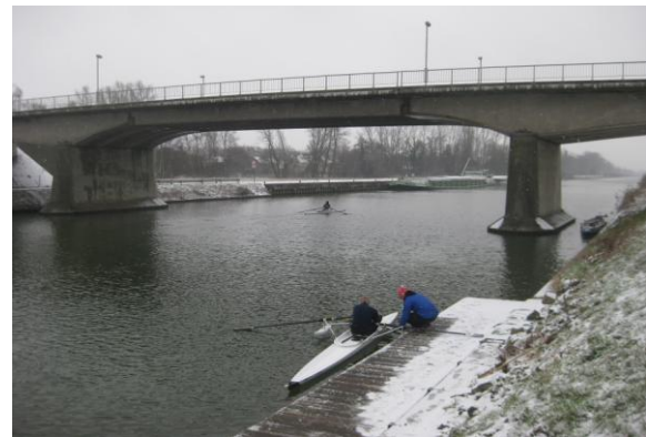
Zullen we deze winter ook in de sneeuw kunnen roeien?